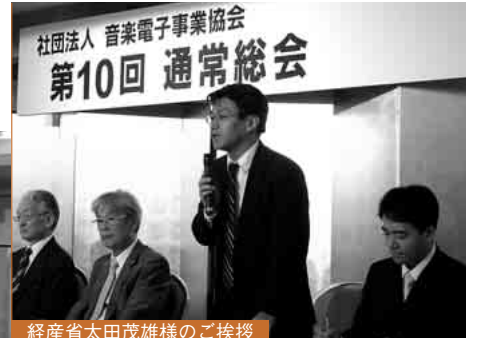
経産省太田茂雄様のご挨拶